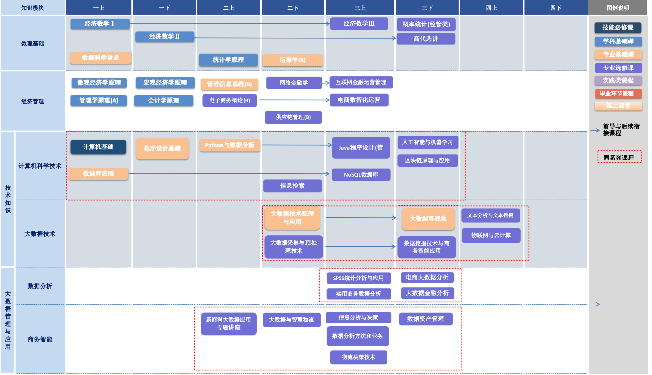
大数据管理与应用专业课程图谱