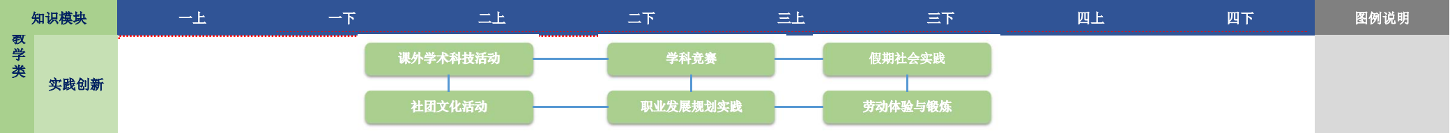
音乐表演专业课程图谱