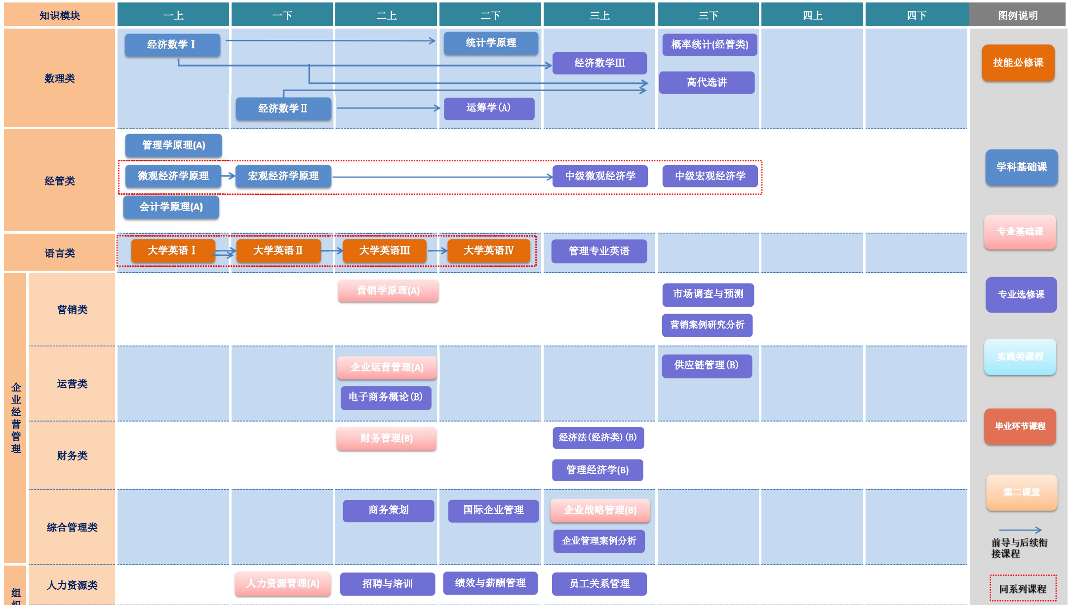
工商管理专业课程图谱 (2024年)