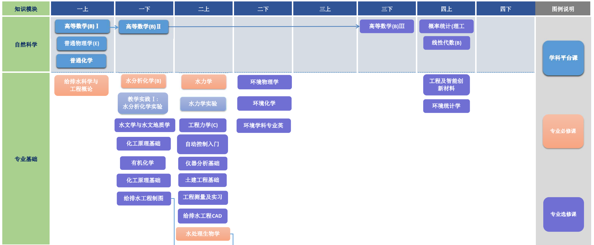
给排水科学与工程专业课程图谱（2024年）